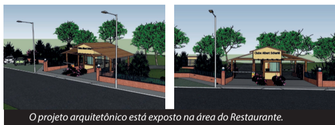
O projeto arquitetônico está exposto na área do Restaurante.